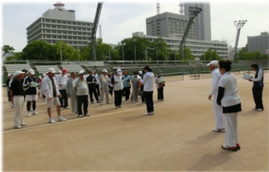
H 26.5.27 広島県シニアテニス連盟夏季大会