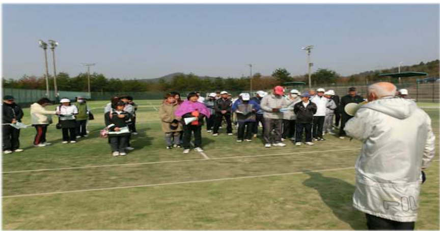
呉市総合スポーツセンターテニスコート